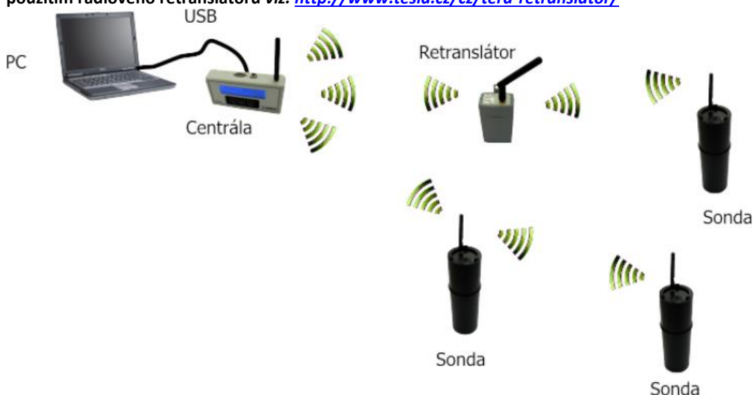
Obrázek 1 - Zapojení centrální jednotky TCR3 v měřícím systému TERA

Pozor! V případě potřeby lze prodloužit rádiový dosah použitím další vložené radonové sondy nebo použitím rádiového retranslátoru viz. http://www.tesla.cz/cz/tera-retranslator/