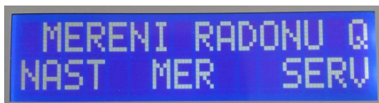
Obrázek 4 - Základní stránka displeje centrální jednotky

Základní stránka displeje na obrázku 4. V tomto režimu je první řádka informační. Svítí na ní nápis MERENI RADONU a pokud je spuštěno měření, v pravém rohu písmeno R nebo Q . Písmeno R znamená, že měření je spuštěno, písmeno Q znamená, že právě probíhá přenos dat. Podle údajů ve druhé řádce se provádí volby tlačítky F1, F2, F3. Ze základního displeje se volí jeden ze tří režimů NAST (F1), MER (F2), SERV (F3).